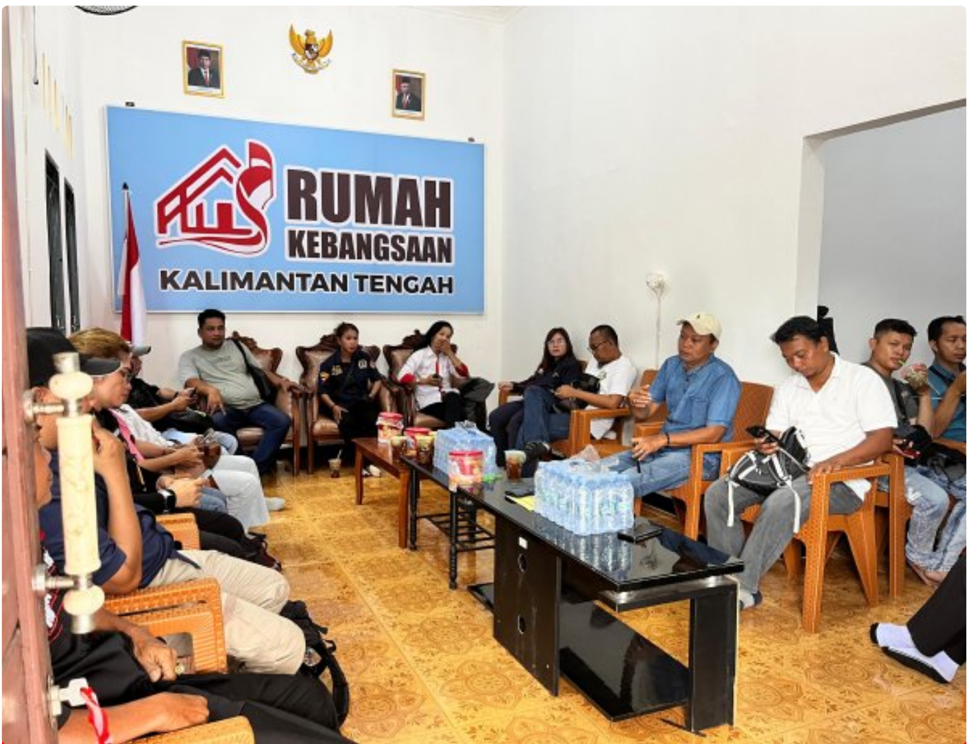
Gambar: Acara Ramah Tamah di Rumah Kebangsaan Kalteng

PALANGKA RAYA - Pelaksanaan pemilihan kepala daerah (Pilkada) yang akan dilaksanakan secara serentak di seluruh wilayah Republik Indonesia, tahun 2024 ini.